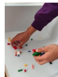
Studenti adulti che sperimentano le attività BBU.