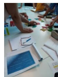
Alcuni educatori per adulti hanno già creato le loro attività e realizzato i loro materiali.