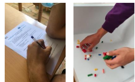
Dospelí študenti experimentovanie s aktivitami BBU