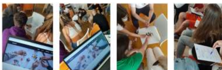
Studenti adulti sperimentazione delle attività BBU in Spagna