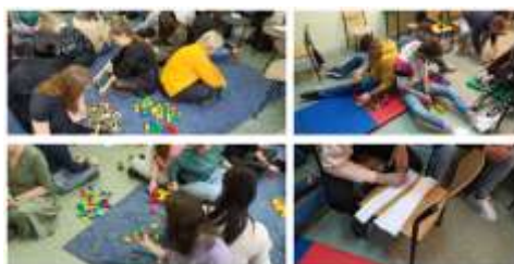
Studenti adulti sperimentazione delle attività BBU in Polonia

Scarica la pubblicazione (versione inglese) qui