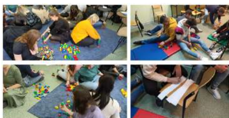
Faza pilotażowa w Polsce