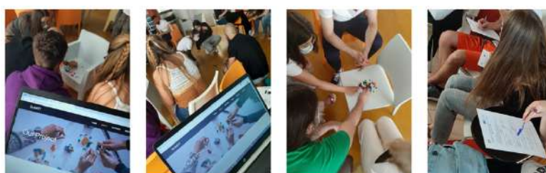
Faza pilotażowa w Hiszpanii