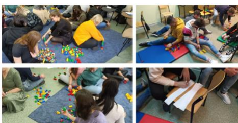
Adultos experimentando con las actividades de BBU en Polonia

Descargue la publicación (versión en inglés) aquí