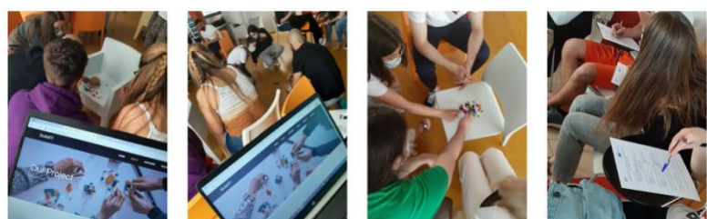
Adultos experimentando con las actividades de BBU en España