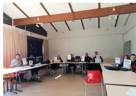
Eventi moltiplicatori in Francia